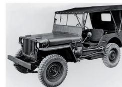
Willys MB, Ford GPW

Cette publication la plus actuelle des Éditions de l'Association du musée suisse de l'armée (VSAM) s'adresse non seulement à toutes les personnes intéressées par la technique automobile et l'histoire militaire, mais aussi à la grande communauté des collectionneurs et des détenteurs de véhicules militaires historiques. Il ne resterait, pensons-nous, que peu de questions ouvertes qui ne trouvent pas de réponse dans le présent ouvrage.