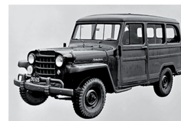
Willys Station Wagon